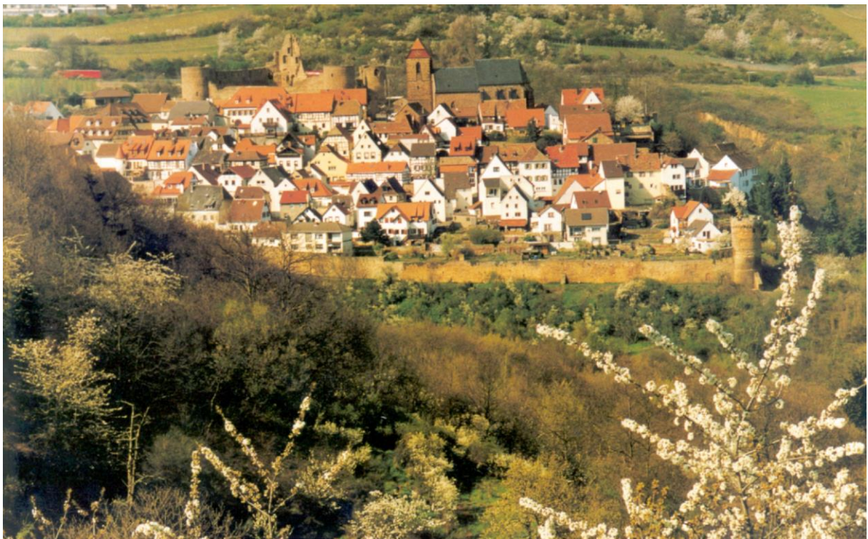
Blick von Battenberg auf Neuleiningen