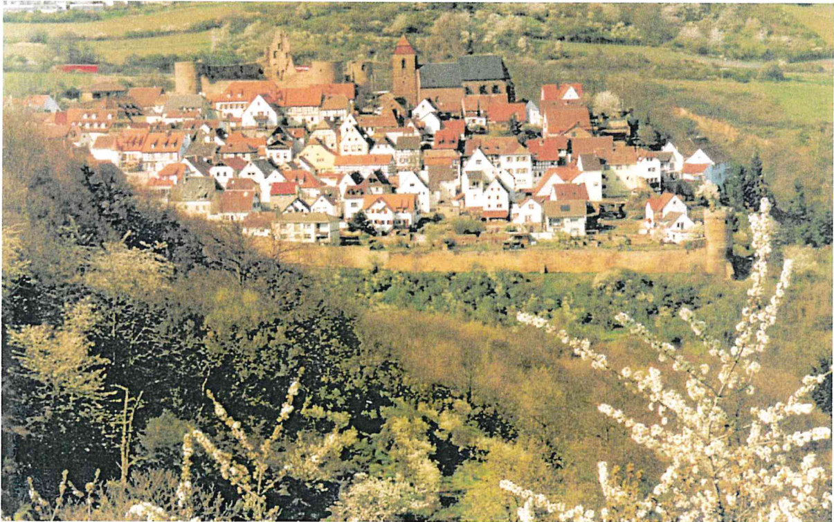
Blick von Battenberg auf Neuleiningen