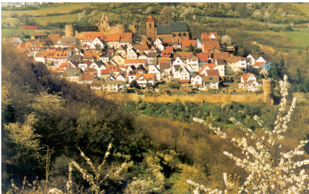
Blick von Battenberg auf Neuleiningen